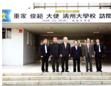
<주한 일본대사 방문>