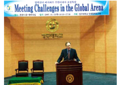
<주한 미국대사 방문>