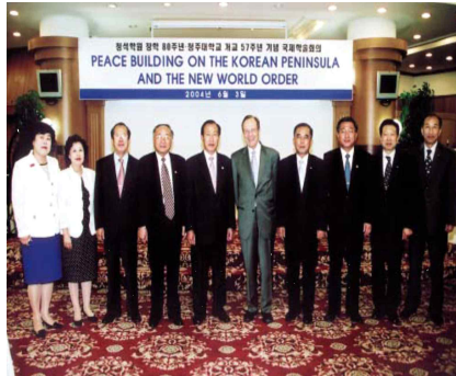
<Former U.S. Secretary of Defense>