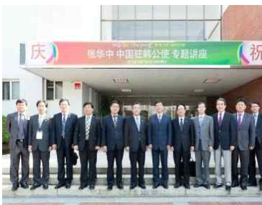
<주한 중국대사 방문>