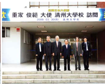
<the Japan Ambassador to Korea>