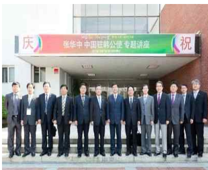
<the China Ambassador to Korea>