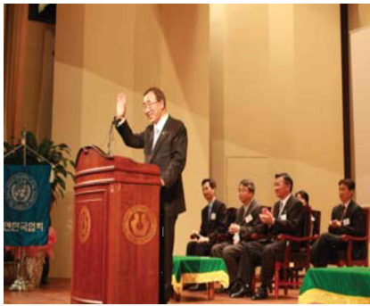
<Former UN Secretary-General>