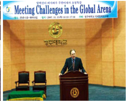
<the U.S. Ambassador to Korea>