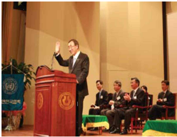
<반기문 전UN총장 강연>