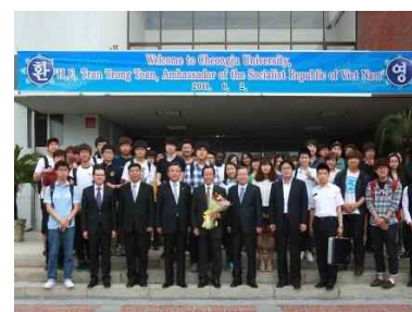
<주한 베트남대사 방문>